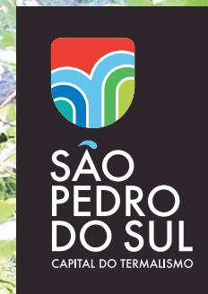
Fundos com degradê