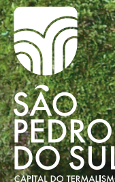
Versão vertical monocromia