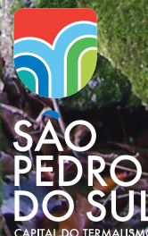
Versão vertical fundo escuro