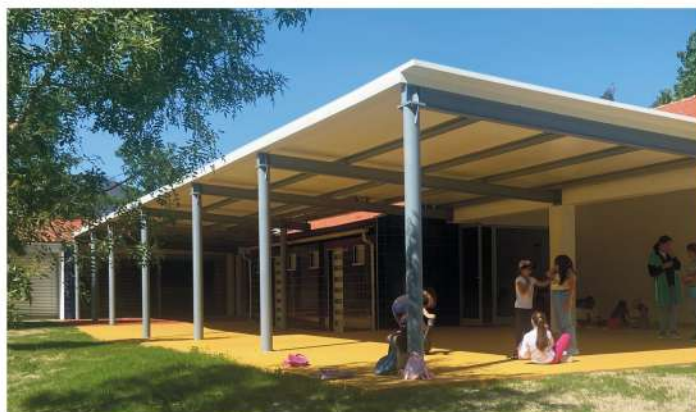
Construção de cobertura - Pólo Pedagógico Carvalhais