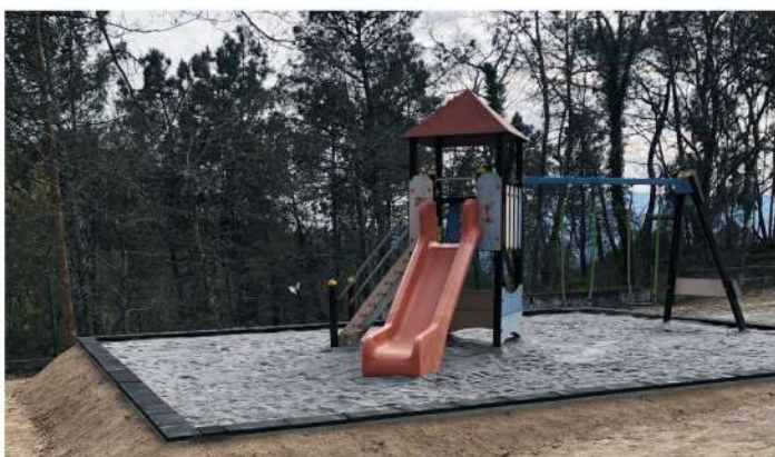
Instalação de Parque Infantil Pinho