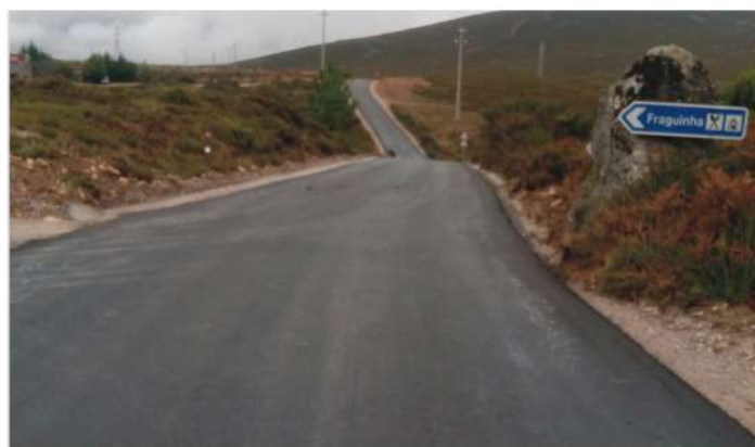
Pavimentação de via - Fraguinha Candal