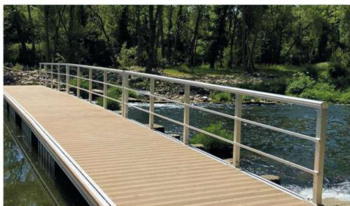
Colocação de plataforma flutuante - Lenteiro do Rio S. Pedro do Sul