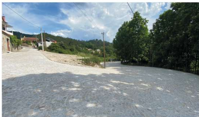
Calçetamento - Adopisco Sul