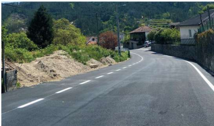
Pavimentação de via - Oliveira Sul