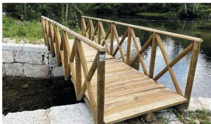
Colocação de ponte Negrelos