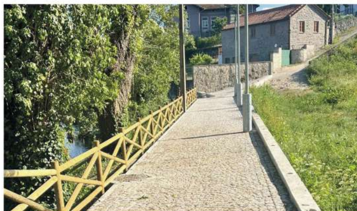
Construção de caminho pedonal - Lenteiro do Rio S. Pedro do Sul