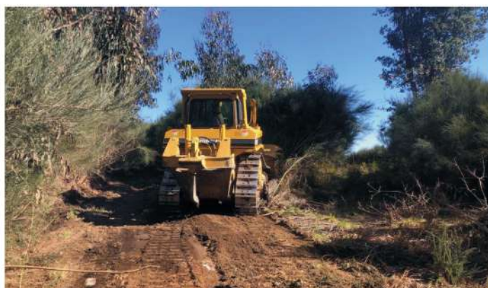
Manutenção de Estradões Florestais Concelho de S. Pedro do Sul