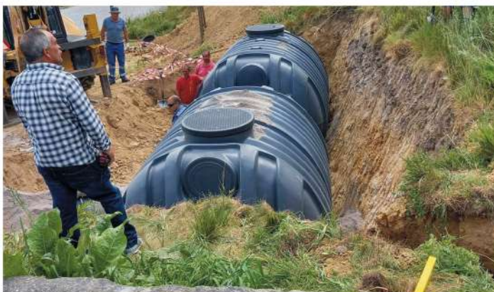
Instalação de depósitos de água para rega Parque da Cidade