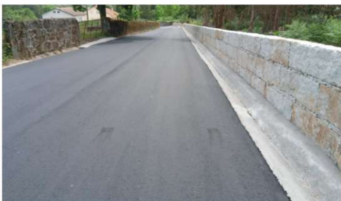
Pavimentação da via Freixo - Santa Cruz da Trapa Santa Cruz da Trapa