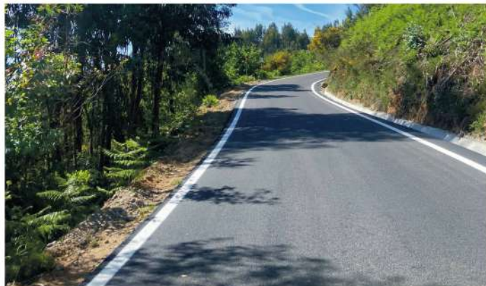
Pavimentação de via - Trigal Sul