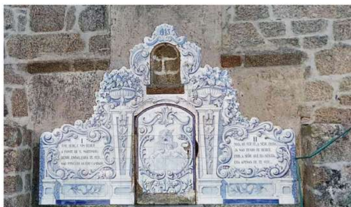
Conservação da Fonte de S. Martinho Termas