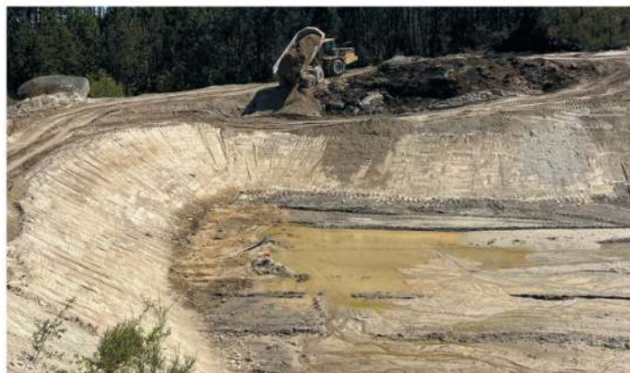
Reabilitação de charca Pindelo dos Milagres