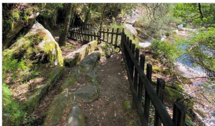
Manutenção do espaço - Poço Azul Santa Cruz da Trapa