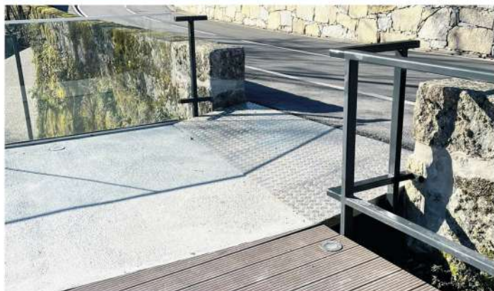
Acesso para pessoas com mobilidade reduzida Termas